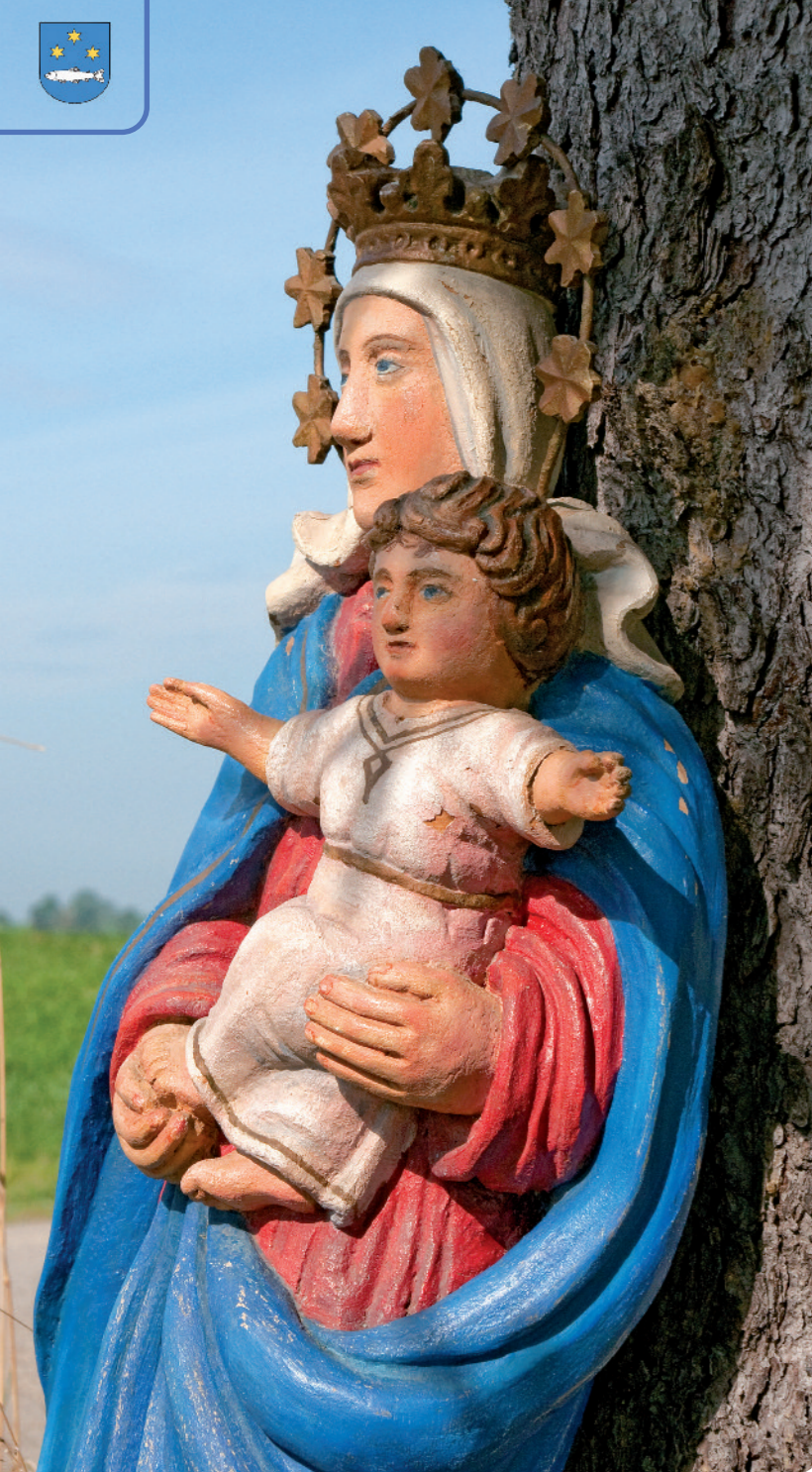
Matka Boska z Aniołowej Kaplicy na Koszarkowym Wierchu w Groniu.