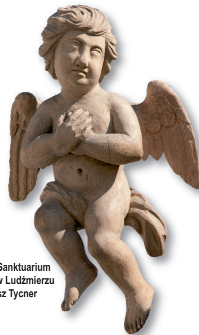
Aniołek, Sanktuarium Maryjne w Ludźmierzu

Artysta urodził się w Gliczarowie i tu spędził swoje życie. Nie tylko rzeźbił (w drewnie, metalu i kamieniu), ale był też świetnym muzykantem i tancerzem. To dlatego mówi się o nim „Leonardo da Vinci z Gliczarowa”. Jednym z jego najbardziej znanych dzieł są trzy ołtarze w „Starym Kościółku” przy ulicy Kościeliskiej w Zakopanem, czy krzyż nad Czarnym Stawem.