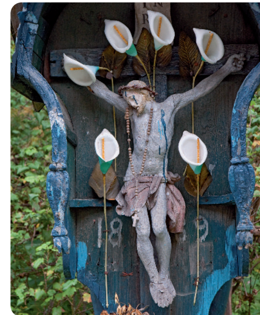
Kapliczka przy Jarząbkach, Gliczarów Dolny.