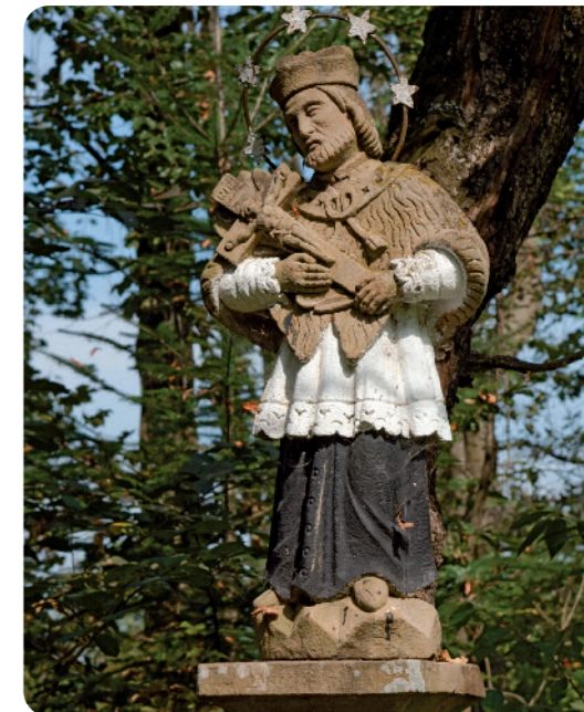
Św. Jan Nepomucen, Gliczarów Dolny

– leży na wysokości 920-1010 m. n.p.m., na linii wododziałowej pomiędzy Białym Dunajcem a zlewnią potoku Skrzywniańskiego. To jedna z najładniejszych widokowo wsi wierzchowych na Podhalu. Pierwsze wzmianki o tej miejscowości pochodzą z roku 1648, kiedy to wzgórze zasiedlili pasterze owiec, wyrębiając dotychczasowy fragment puszczy podhalańskiej.